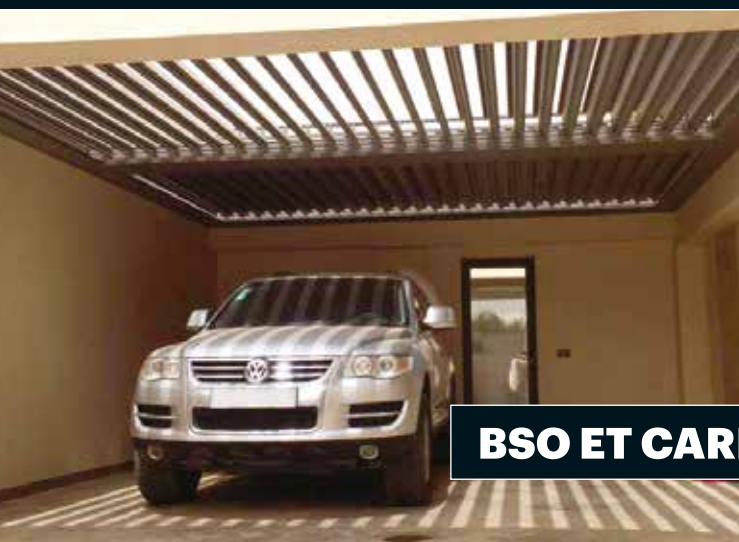
BSO ET CARPORT OUVERT