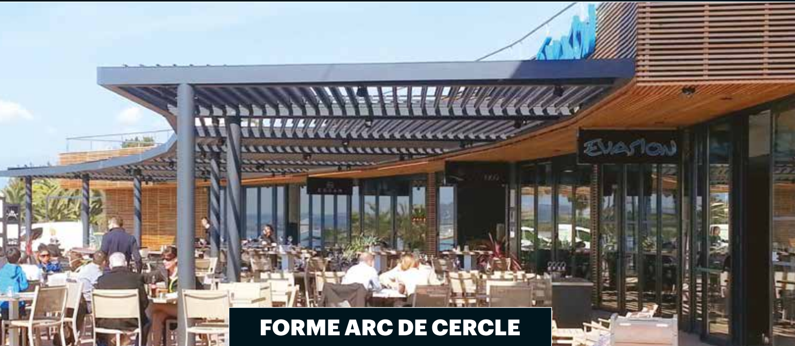
FORME ARC DE CERCLE