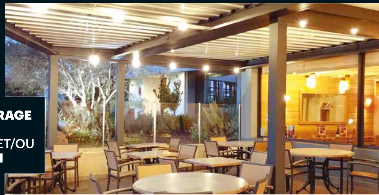
ÉCLAIRAGE LED : SPOT ET/OU RUBAN