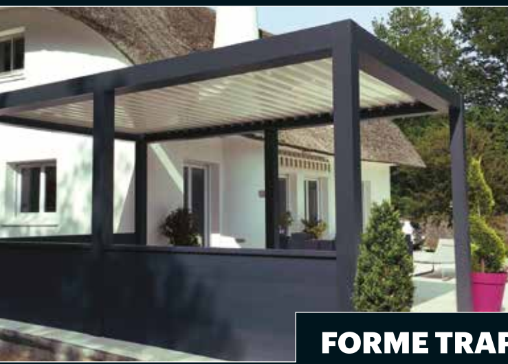
FORME TRAPÈZE - TRIANGLE

Au delà des formes classiques, nos modules s'assemblent pour créer des espaces uniques.