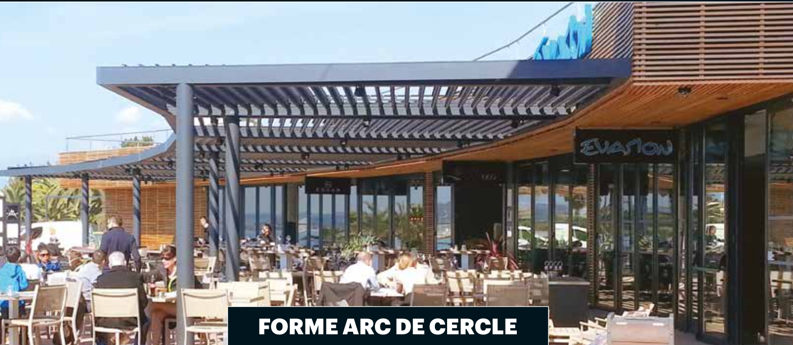
FORME ARC DE CERCLE