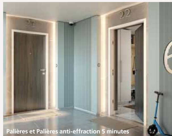
Palières et Palières anti-effraction 5 minutes

Protéger ses biens des agressions extérieures, protéger ses proches du bruit et de l'incendie, ce sont quelques unes des multiples fonctions d'un bloc-porte palier anti-effraction. Pour une construction neuve ou en rénovation, ces blocs-portes assurent une sécurité optimale et viennent mettre en exergue votre logement grâce aux multiples finitions disponibles.