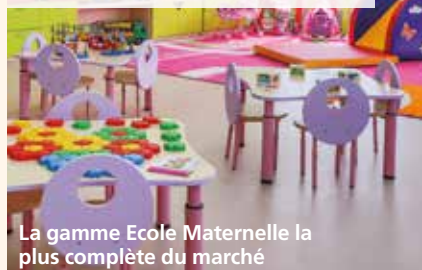
La gamme Ecole Maternelle la plus complète du marché

Les blocs-portes Ecole Maternelle, avec des joints anti-pince doigts intégrés, préservent l'intégrité des doigts des enfants en toute discrétion.