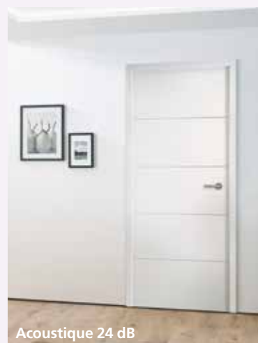
Acoustique 24 dB