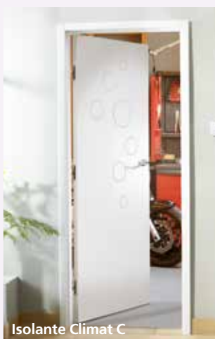
Isolante Climat C