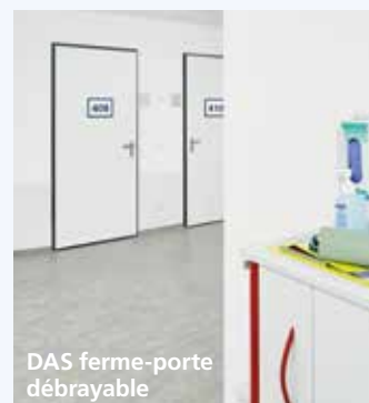
DAS ferme-porte débrayable