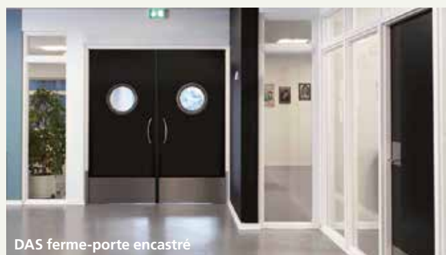
DAS ferme-porte encastré